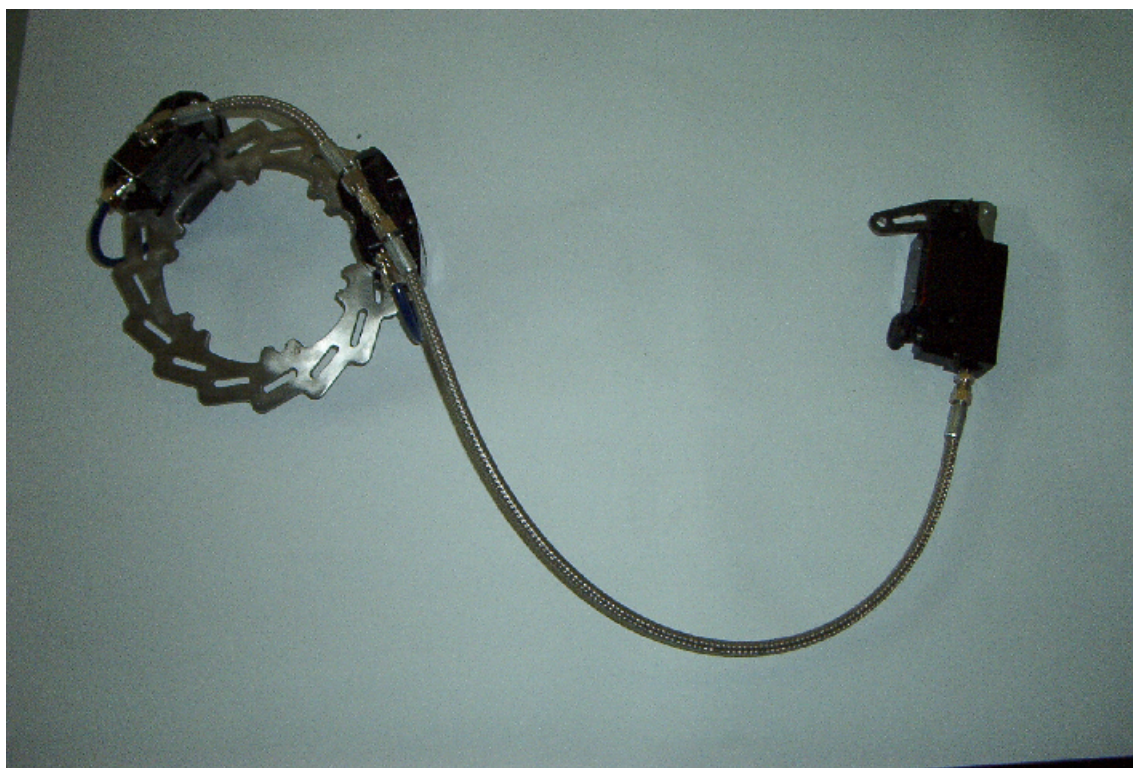
PHOTO DU SYSTÈME COMPLET PHOTO OF COMPLETE SYSTEM

This Homologation Form reproduces descriptions, illustrations and dimensions of the brake system at the moment of the CIK-FIA homologation. The Manufacturer may modify them, but only within the limits set by the CIK-FIA Regulations in force.